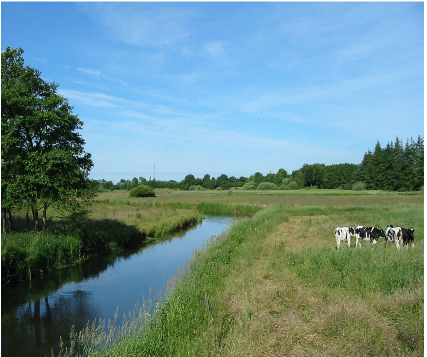
Kongeåen ved Skodborghus